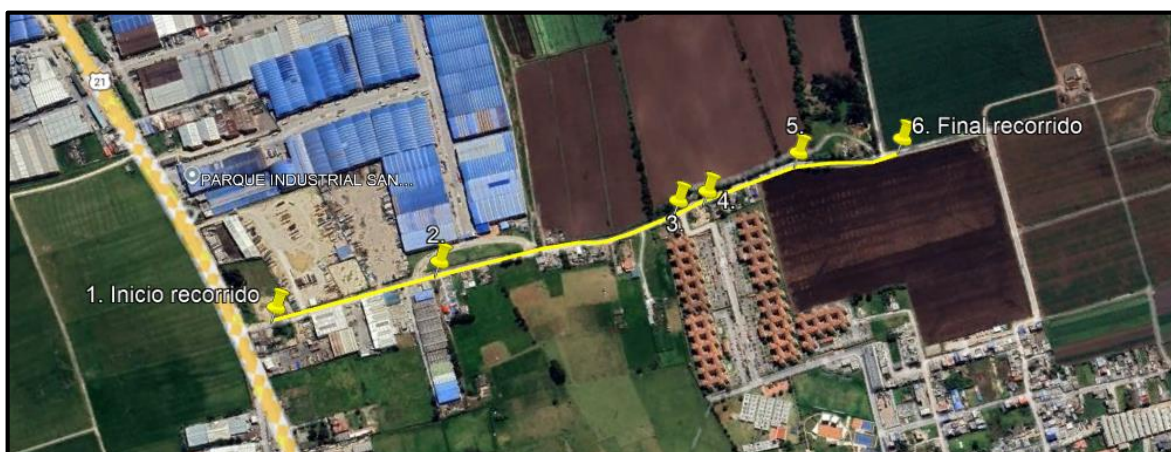
Ilustración 1. Recorrido de control y vigilancia en la vereda El Hato.

Con base en lo anterior, el día 27 de septiembre de 2024 se realizó recorrido de control y vigilancia en la vereda El Hato desde las coordenadas 4°43'11.622"N – 74°11'52.512"O hasta las coordenadas 4°42'39.588"N – 74°11'36.078"O (ver ilustración 1. Ruta amarilla)