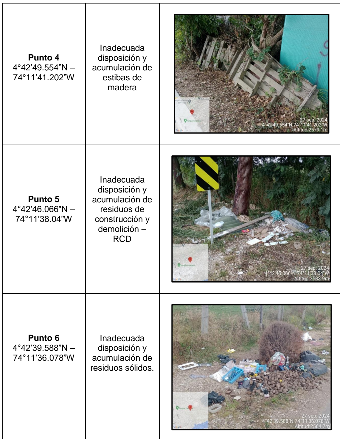
Tabla 1. Hallazgos recorrido de control y vigilancia vereda, El Hato.