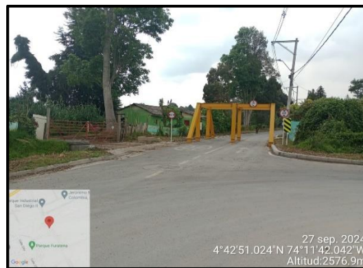
Ilustración 3. Evidencia recorrido, punto 3.