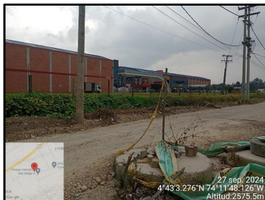
Ilustración 2. Evidencia recorrido, punto 2.

Adicional a ello, en los puntos 2 y 3 no se evidenciaron anomalías que afecten el componente ambiental propio del recorrido de control y vigilancia en la vereda El Hato, como se observa en las siguientes ilustraciones: